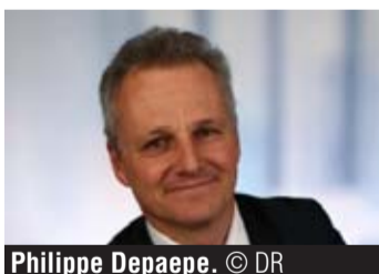
Philippe Depaeppe.

« Il faut sensibiliser les entreprises »